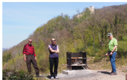
Tourenleitung, Text und Fotos: Luzia Suda